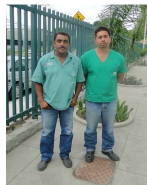
Equipe da Portaria