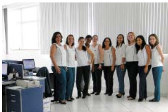
Financeiro, Contabilidade e Dpto. Pessoal.