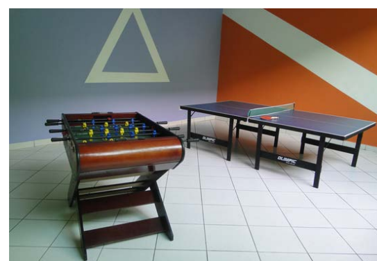
Sala de Jogos