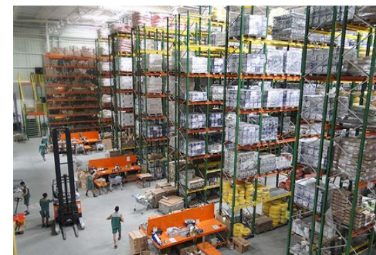
Centro de Distribuição