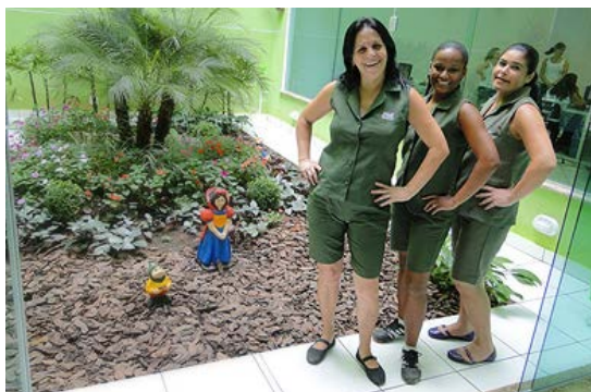
Equipe de Conservação